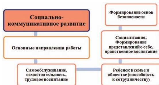
Рис 1. Модель коррекционной работы с детьми с ОВЗ по образовательной области: Социально-коммуникативное развитие к образовательной программе «От рождения до школы».

4. Устинова Е.В. Детский церебральный паралич: психологическая помощь дошкольникам. – М.: Книголюб, 2007.