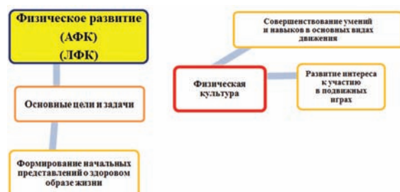
Рис 5. Модель коррекционной работы с детьми с ОВЗ по образовательной области: Физическое развитие к образовательной программе «От рождения до школы».

8. Рунова М.А. Дифференцированные занятия по физической культуре с детьми 5–7 лет. – М., Просвещение, 2005.