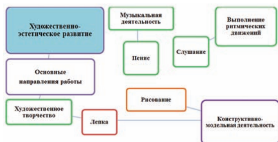
Рис 4. Модель коррекционной работы с детьми с ОВЗ по образовательной области: Художественно-эстетическое развитие к образовательной программе «От рождения до школы».