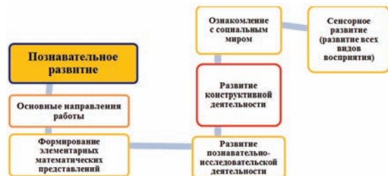
Рис 2. Модель коррекционной работы с детьми с ОВЗ по образовательной области: Познавательное развитие к образовательной программе «От рождения до школы».

6. Титова О.В. Слева-справа. Формирование пространственных представлений у детей с ДЦП. – М., 2004.